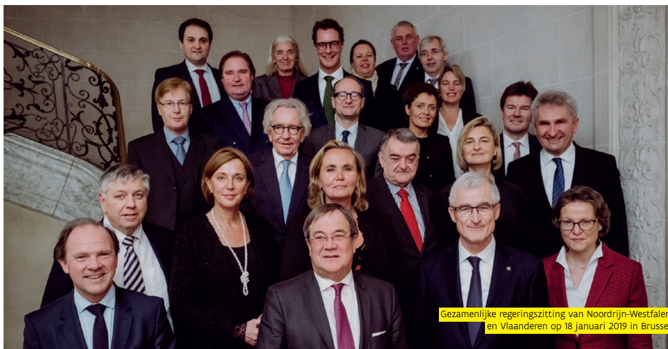
Gezamenlijke regeringszitting van Noordrijn-Westfalen en Vlaanderen op 18 januari 2019 in Brussel

Zowel de Duitse federale Regering, de Länder als Vlaanderen zijn pleitbezorger van subsidiariteit in de Europese Unie. Daarbij moet de meerwaarde van Europees optreden steeds aangetoond worden. Vlaanderen wil samen met de Duitse federale Regering en de Duitse Länder het momentum aangrijpen om in de Europese instellingen het respect voor het subsidiariteits-principe een meer centrale plaats te geven in het Europees beleid.